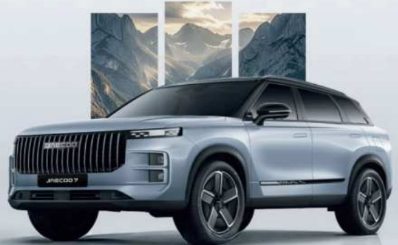
Jaecoo 7 Comfort-Line Plug-In-Hybrid mit SHS