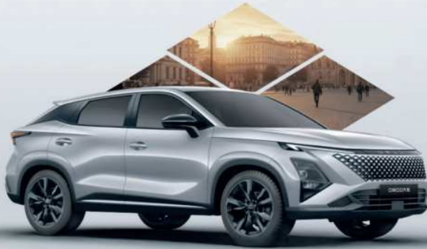
Omoda 5 Comfort-Line Hybrid mit SHS